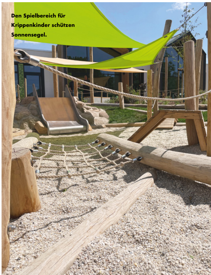
Den Spielbereich für Krippenkinder schützen Sonnensegel.